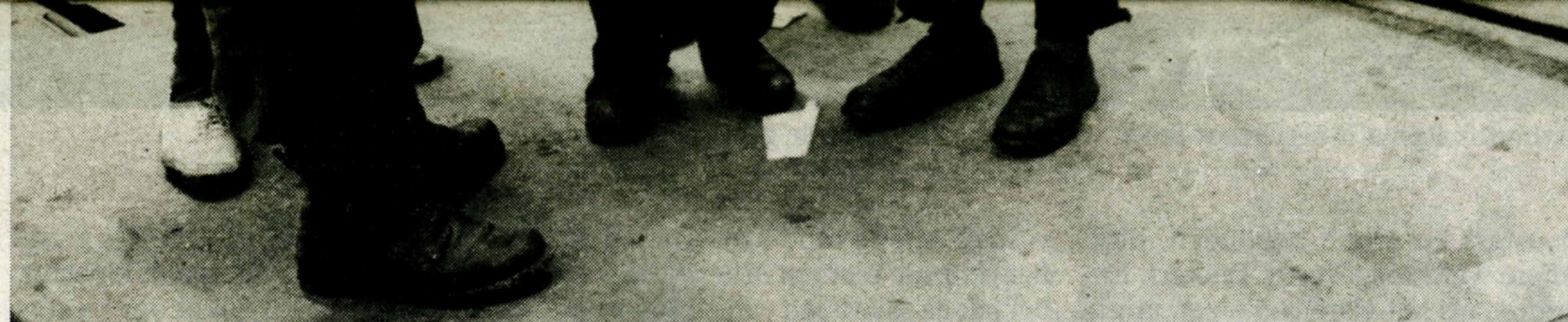
Maart 1947: Britse soldaten troosten kinderen van wie de ouders zijn omgekomen tijdens confrontaties tussen illegale Joodse immigranten en het Britse leger.