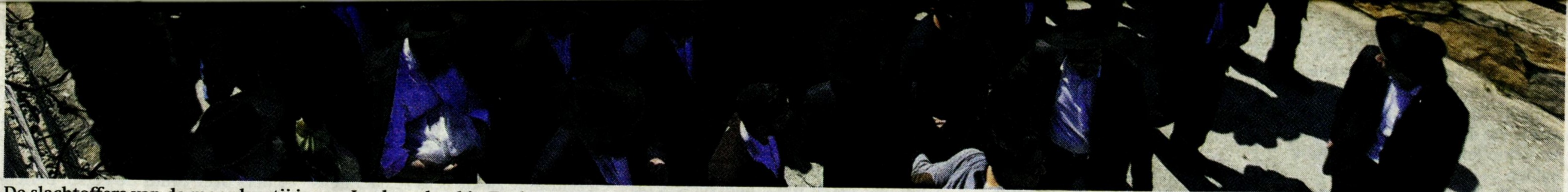
De slachtoffers van de moordpartij in een Joodse school in Toulouse, vorige maand, worden in Israël begraven.