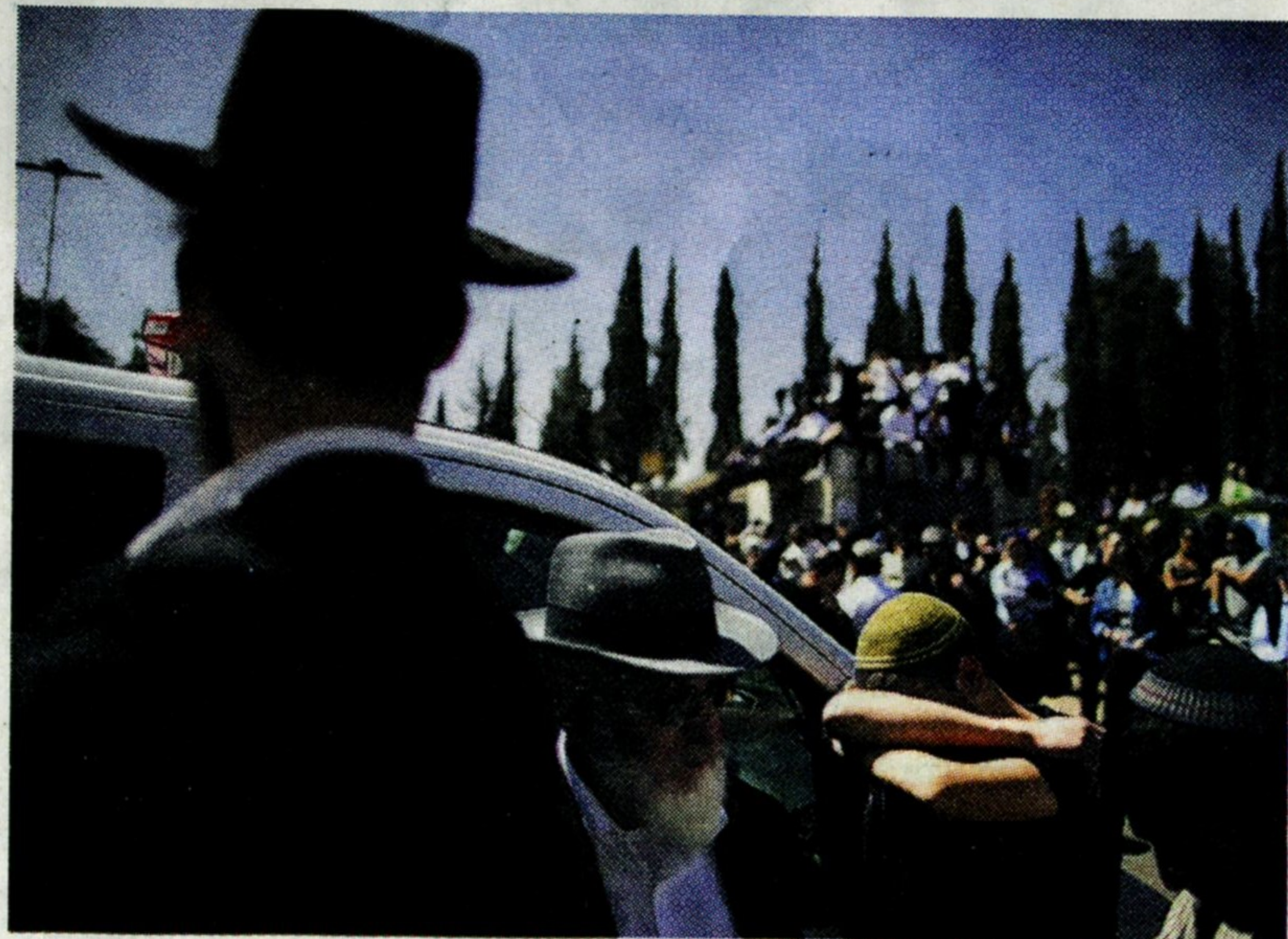
Rouw om de doden van Toulouse.

“Herzl wilde van Israël een normaal land onder normale landen maken. Dat dit niet gelukt is, betekent niet dat het streven onzinnig is. Bij een normaal land horen conflicten en fundamentele meningsverschillen zonder onmiddellijk verzeild te raken in vier millennia geschiedenis. Telkens opnieuw blijkt het belangrijk om de specifieke plaats en de eigen rol van de Joden in de moderne natiestaat te analyseren in plaats van er een algemene theorie op los te laten. En daarvoor is het noodzakelijk de begrippen antisemitisme, antizionisme, en kritiek op Israël uit elkaar te halen. Hoe lastig dat ook is.”