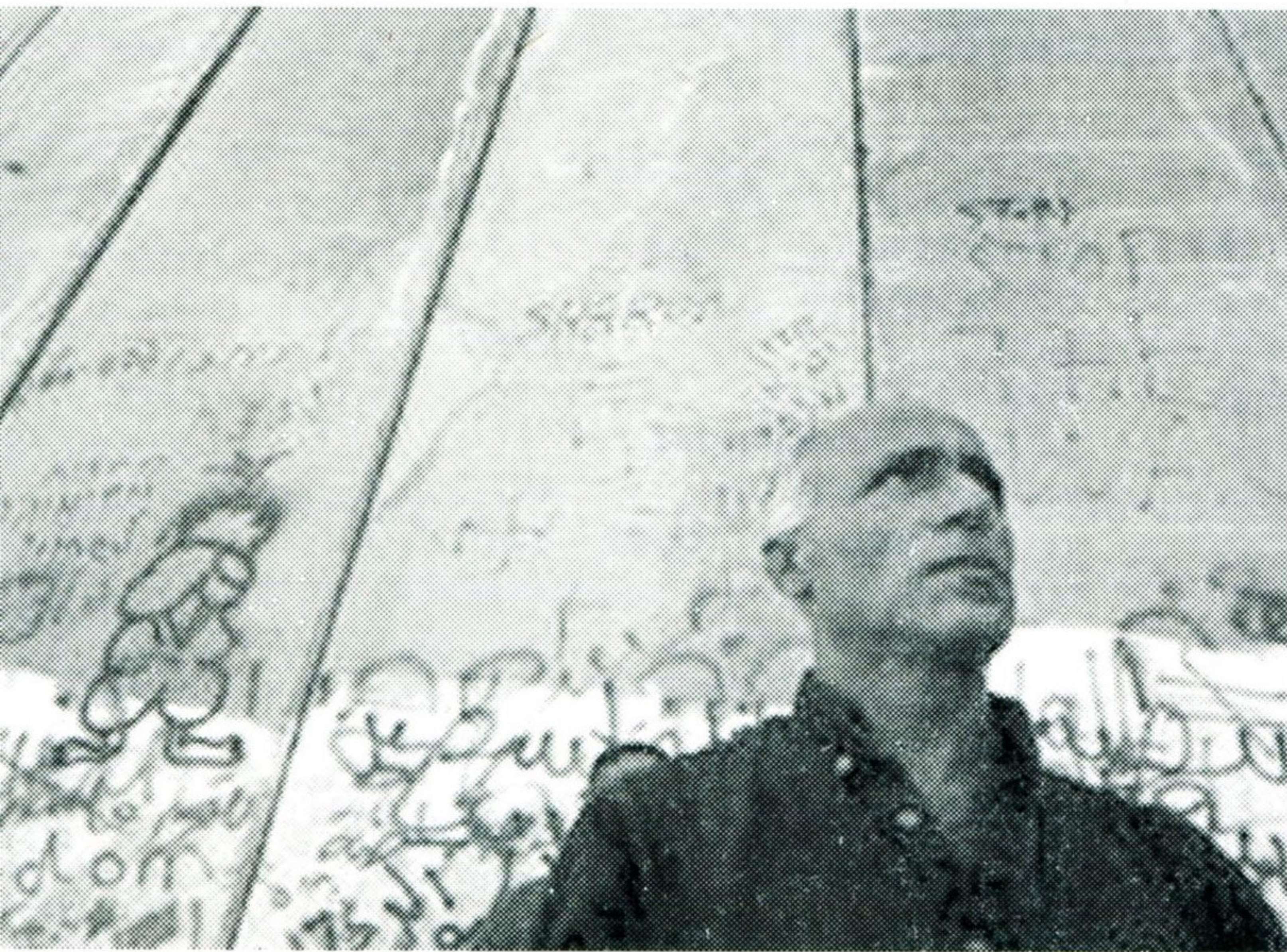
Vanunu staat voor de separatie-muur tijdens een protest tegen de controversiële Israëlische veiligheidsbarrière in Oost-Jerusalem op 27-08-'04.

Inleiding tot "I am your spy" (Ik ben uw spion), geschreven vanuit de Ashkelon Gevangenis, 1987 Israël