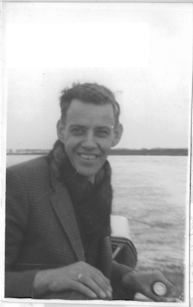
want G'e maakte van allen een foto klaar.