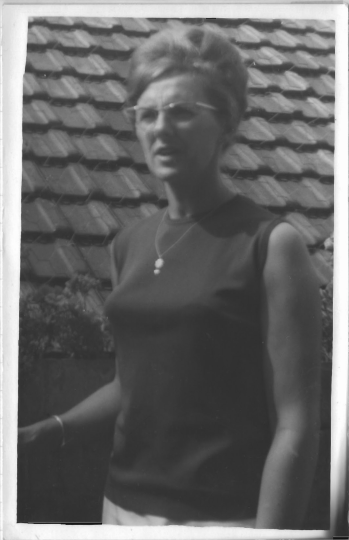
was de familie in dit jaar.