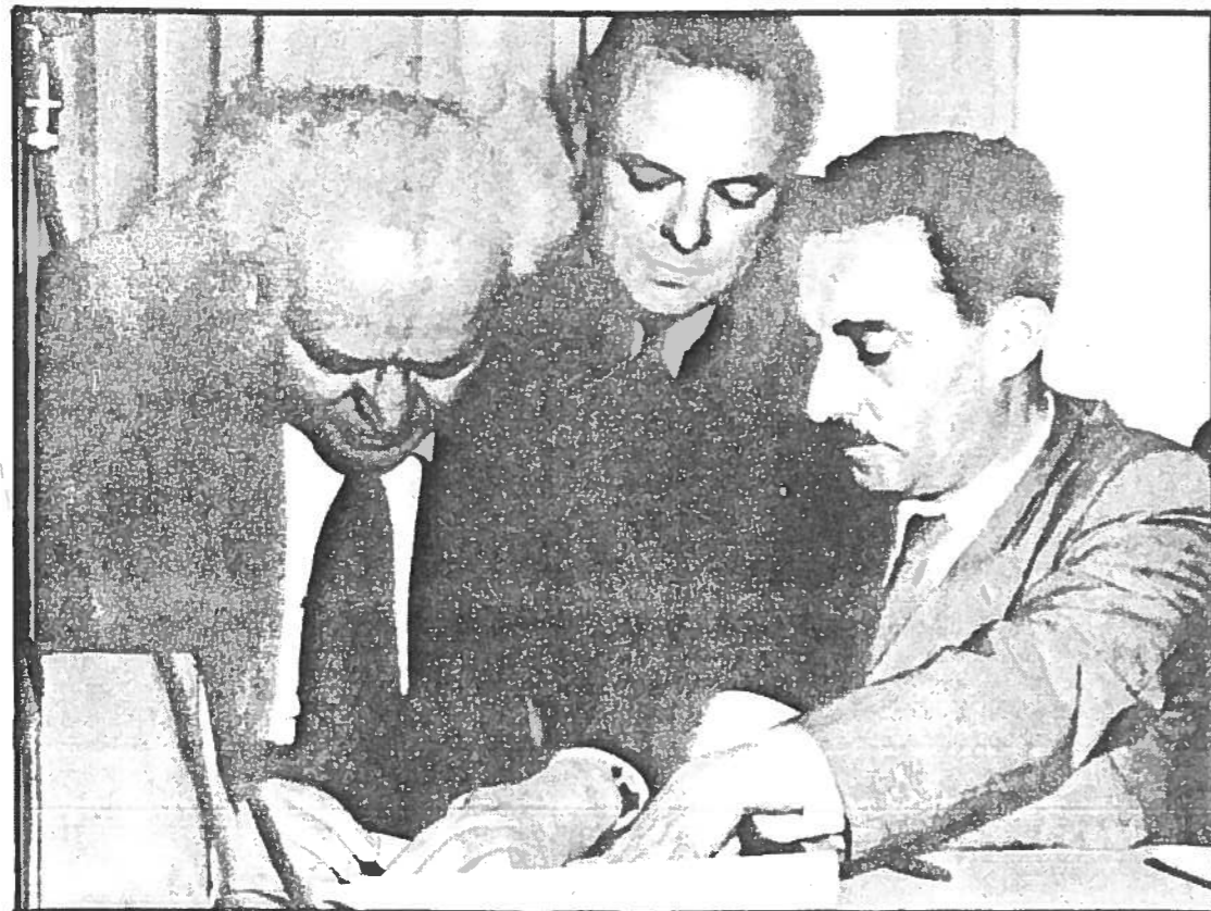
In de nacht van 14 op 15 mei 1948 eindigde het Britse mandaat over Palestina. Enkele uren tevoren werd de onafhankelijkheid van Israël uitgeroepen. Premier Ben Goerion (links) tekent het proclamatiestatuut.

Jaffa. Jitschak Rabin, de tegenwoordige minister van defensie, was commandant van de legereenheid die deze steden veroverde. Ik geef een korte beschrijving van de gebeurtenissen in Lydda, als één voorbeeld uit vele. Na enkele luchtaanvallen vluchtte een deel van de bevolking. Men seinde naar de bevelvoering: 'Het is van belang door te gaan met bombarderen. De vlucht van vrouwen, bejaarden en kinderen dient vergemakkelijkt te worden.' Later werd gerapporteerd: 'De luchtaanvallen en ons artillerievuur hebben paniek en vlucht veroorzaakt onder de bevolking alsmede de bereidheid tot overgave. Doorgaan met bombarderen, ook met brandbommen.' Er waren 250 doden en vele gewonden. De legerstaf besprak de mogelijkheid om alle inwoners te deporteren, maar er viel geen beslissing. Toen gingen Ben Goerion, Allon en Rabin naar buiten. Allon vroeg: 'Wat moeten we met de Arabieren doen?' Ben Goerion maakte een